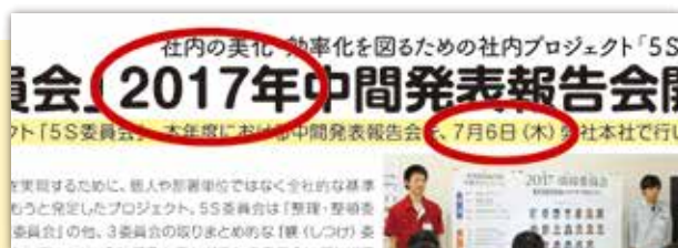
例えば、上記のような見出し等に入る「年号」や「日付」はチェックの対象。完全データ支給のものでも、印刷させていただく以上は、できる限りのチェックをさせていただきます。