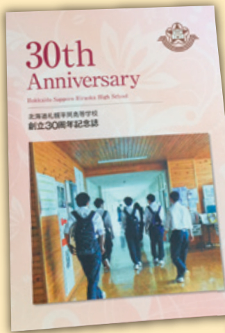
仕様：A4判 オールカラー 無線綴じ 本文104ページ

昨年11月には記念式典が行われ、今回の記念誌完成により、次のステージへ進む節目にお祝いを申し上げます。弊社はお客様の節目となる記念誌づくりの一助となるよう今後も努力してまいりますのでよろしくお願いいたします。